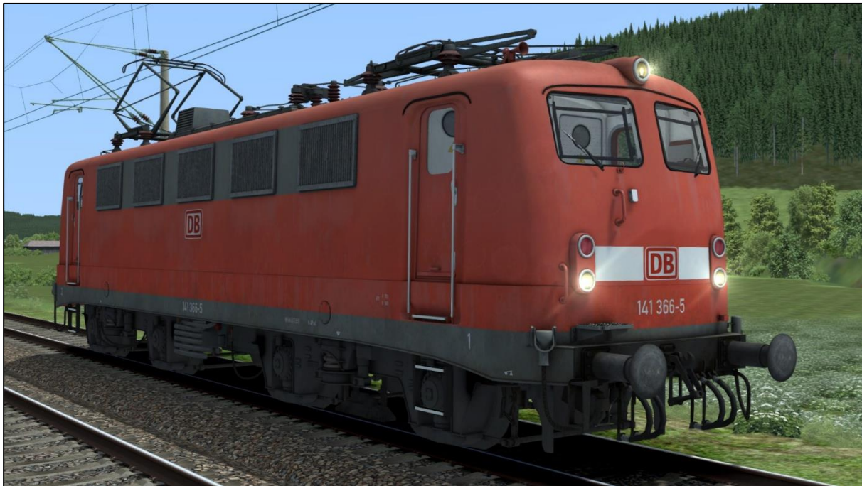
BR141 366-5 Verkehrsrot

kompatibel mit Train Simulator 2017 und höher