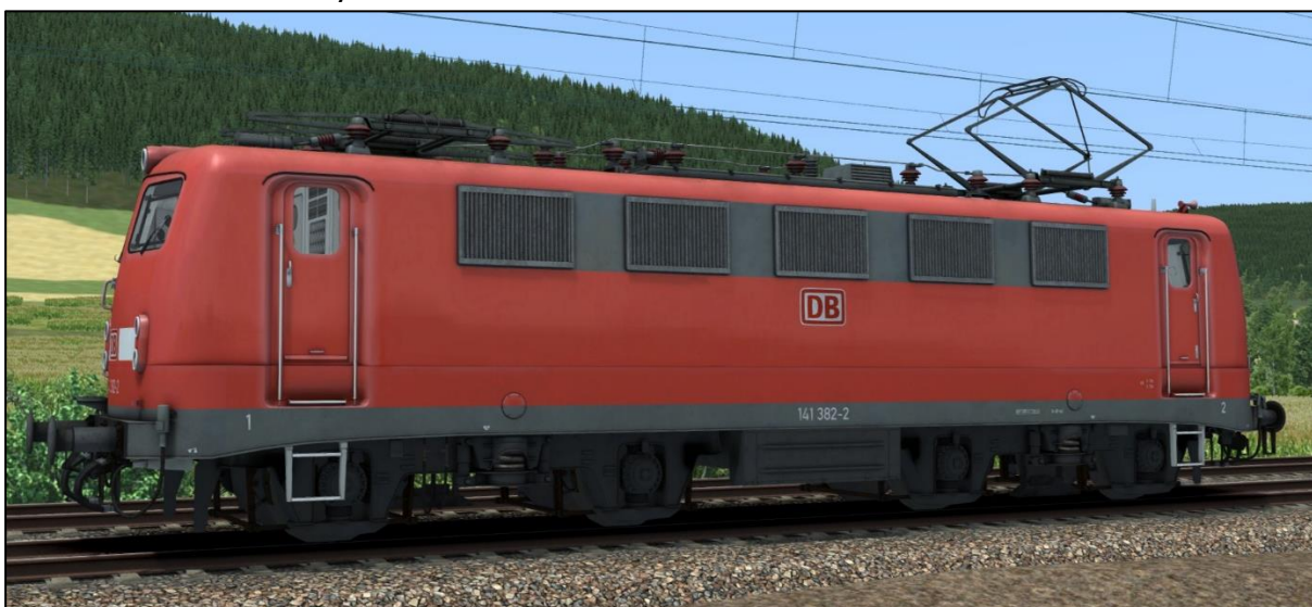
DB BR141 382-2 oder dynamische Nummer