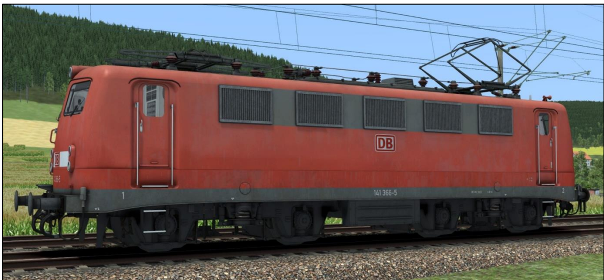
DB BR141 366-5 oder dynamische Nummer