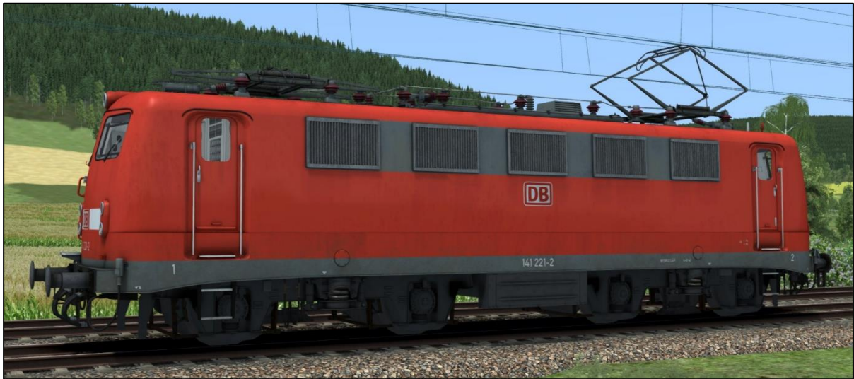
DB BR141 221-2 oder dynamische Nummer